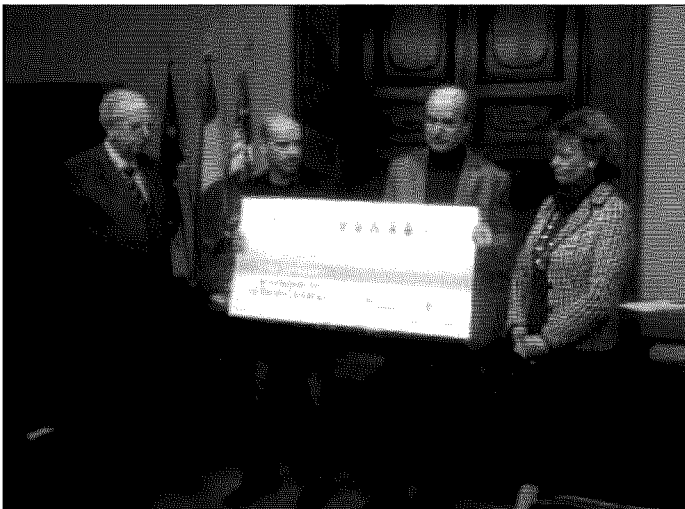
Concorso Il comune tifernate ha gareggiato insieme ad altre sei municipalità regionali